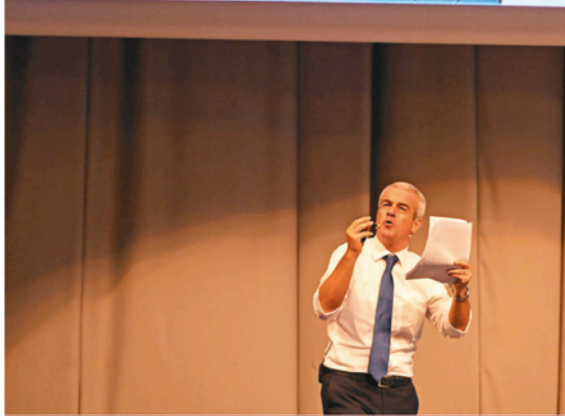
Un'immagine della Divina Commedia durante una delle serate curate dal prof. Gregorio Vivaldelli

Dante scrisse la Divina Commedia, con l'ardore di un padre della Chiesa, per generare alla fede